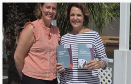
Wensenboekje op Curacao