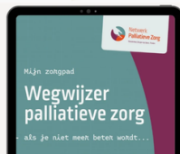
Wegwijzer Palliatieve Zorg